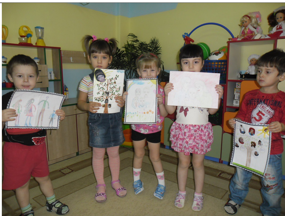
Рисунки на тему: «Наш семейный отдых»