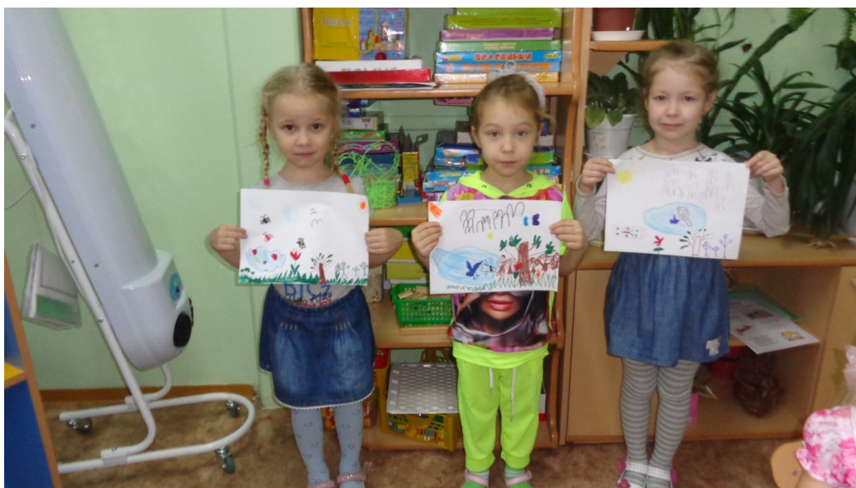
Изготовление открыток к празднику мам