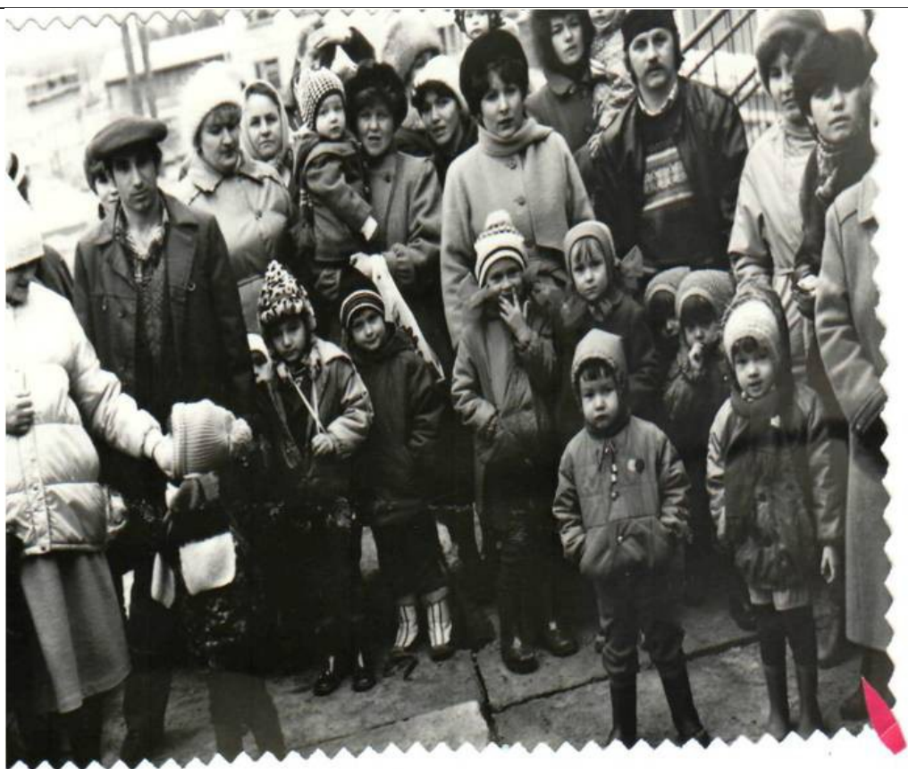
Мой любимый уголок в группе «Одуванчик»